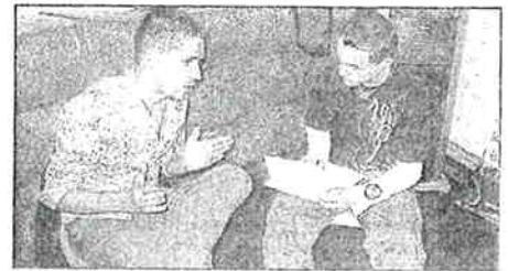
Des contacts directs entre les chefs d'entreprise ou leurs représentants, et les élèves

Pépinière d'Entreprises Innovantes AXONE