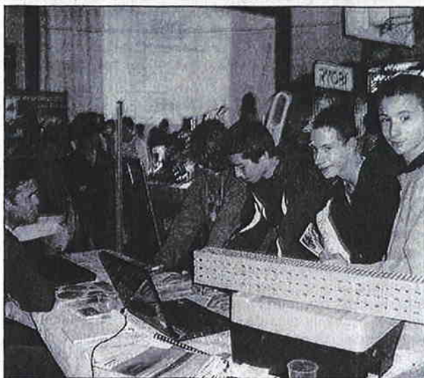
Le courant est bien passé entre les jeunes et les professionnels présents

L'orientation des troisièmes et leur avenir professionnel est un des enjeux majeurs du collège et au Val d'Argent, beaucoup d'actions sont menées en ce sens, pour amener les jeunes, de manière attractive et concrète, à se questionner, à observer le monde de l'entreprise et à envisager dans quelle branche ils aimeraient se diriger.