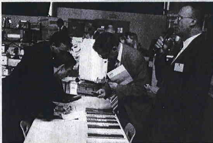
Un véritable temps d'échanges

Plus de 40 chefs d'entreprises étaient présents lors de ce Forum, partageant leurs savoir-faire, leurs connaissances et leurs projets de dé-