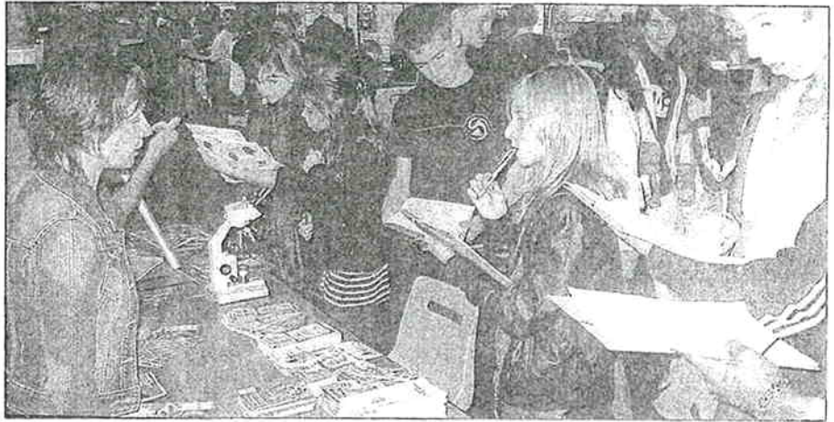
Sur les 250 scolaires accueillis, beaucoup se sont intéressés aux stands de biotechnologie

qu'une partie de la réalité de l'entreprise. Ouvert à tous ceux qui s'intéressent à la vie du territoire et à l'évolution des techniques (plusieurs entreprises sont orientées vers les énergies renouvelables), le forum se poursuit aujourd'hui, de 9 heures à 18 heures 30, avec à 11 heures 30, une allocution de Michel Mercier, ministre de l'espace rural et de l'aménagement du territoire. Des ateliers conférences sur les aides à l'investissement ou au recrutement, le très haut débit, les enjeux de l'économie d'énergie auront lieu l'après-midi avant, à 17 heures 30, une conférence plénière sur l'ouverture à l'international en présence d'une délégation canadienne.